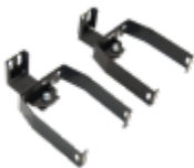
REGULOWANY UCHWYT MONTAŻOWY